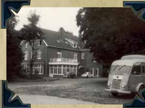
Verkeersschool de Varenkamp