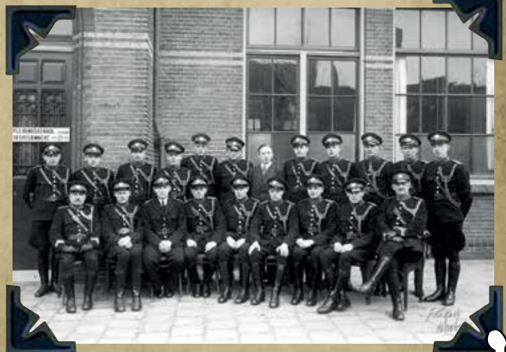
Opleiding tot Rijksveldwacht in Nieuwersluis