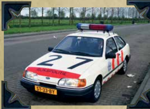
Willem Vleeming 1988 Kesteren