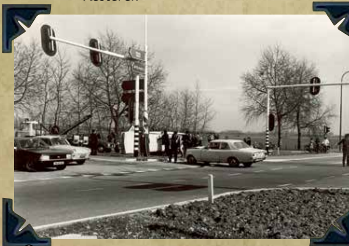
Rijkspolitie aanrijding Beek 1979