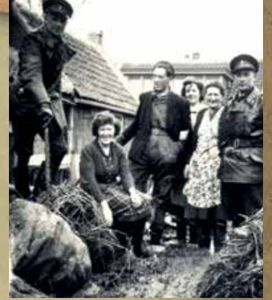
Watersnood februari 1953