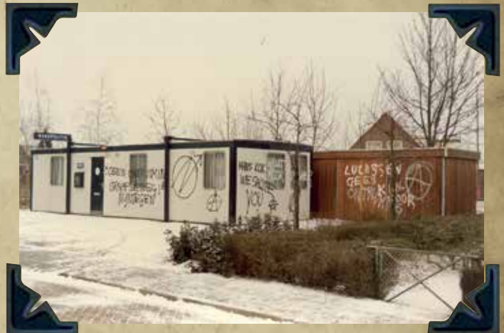
Bureau Ooij beklad